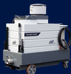
SQ 603M TC

La versione 3M TC è tipicamente apprezzata per la potenza incredibile e la versatilità che si ottiene grazie alla tecnologia TURBO®, è sufficiente una comune alimentazione 230V monofase 16A.